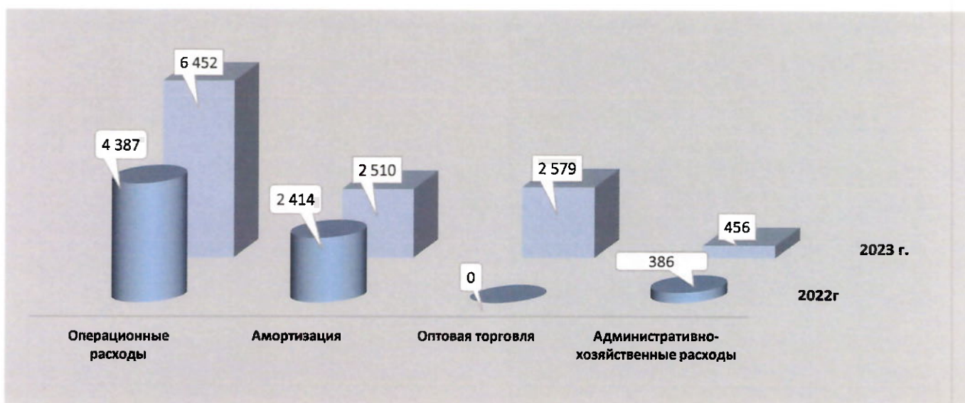
Рис. 3 Структура расходов по основной деятельности, млн. руб.